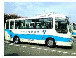
組合バスもリースです！

車両をリースする主なメリットである、資金面や車両管理、車両維持に係わる費用処理等各業務の削減に加え、各リース会社独自のサービスにて卸センターの皆様へ貢献させて頂きたく、組合担当が随時ご提案させて頂きますので、何卒宜しくお願い致します。