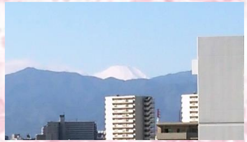
卸センター内から見る冬姿の富士山

卸センターの皆様、新年明けましておめでとうございます。皆様には日頃より当組合の活動にご理解とご協力を賜り、厚く御礼申し上げます。