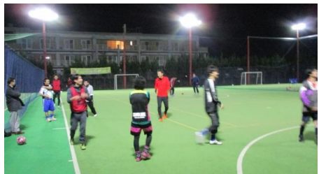
新規メンバーも参加し、益々盛り上がる活動内容となりました！

昨年11月より始動しました、卸センターフットサル同好会が第2回目の活動を行いました！