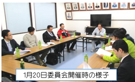
1月20日委員会開催時の様子

卸センター内の事業承継問題や災害発生時の対策、人材確保等の課題について共に解決に向けてご協力を頂ける若き経営者様・経営幹部様・事業所長様のご参加を心からお待ちしております。ご興味のある方は是非事務局までご連絡下さい。また、事務局からも皆様へお声を掛けさせていただきますので、何卒宜しくお願い致します。