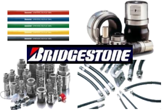
ブリヂストン社製品を中心に、多様な工業用ゴム製品を扱う。

昭和36年、弊社はブリヂストンの販売代理店として創業しました。 工業用ゴム製品から始まり、現在は樹脂、金具類等多様な分野に商品の幅を広げています。 昨今では、インターネット販売が普及し、工業用品とその殆どが通販での購入可能な時代となりましたが、弊社の取り扱う商品群は兎角仕様が多く、選定が非常に困難な分野ですので、今尚お客様から多くのお問合せやご注文を直接頂いております。 その為、弊社がモットーとするのは顧客とのコミュニケーションを密に取る事です。 そして加工を自社でも請け負う技術と、工業用ゴムを五十余年取り扱ってきた実績をもとに、お客様の「要望」にこたえることにも取り組んでおります。 要望をさらにブラッシュアップさせたご提案を行うよう努めています。 その甲斐あって、本年3月にはブリヂストン化工品ジャパン様より、販売キャンペーンの好成績を評して、感謝状を頂戴しました。 また、弊社単体での営業活動に留まらず、所在地である協同組合横浜総合卸センターへの加入・事業参加をはじめ、神奈川県機械器具材料商業協同組合および東部工業用ゴム製品卸商業組合の組合員としても、協力企業との連携のもと、社会貢献の場を広げています。 お客様からの信頼にさらに応えるべく、今後も「訊ける」「頼れる」「任せられる」企業として、成長と発展を志します。